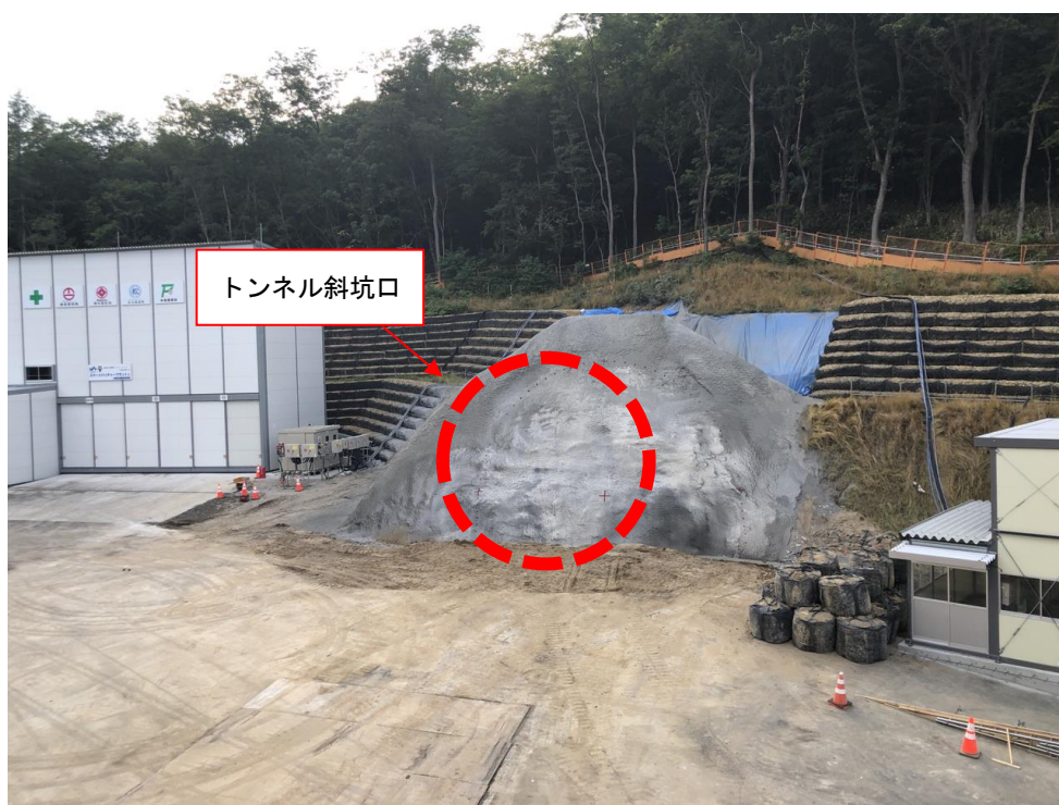
【現在の坑口の写真】

なお、安全祈願は、新型コロナウイルス感染症拡大への影響を考慮し、最小限の出席者で実施いたします。